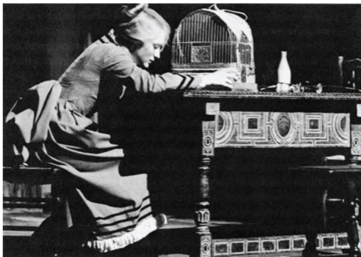
Meryl Streep en la señorita Julia